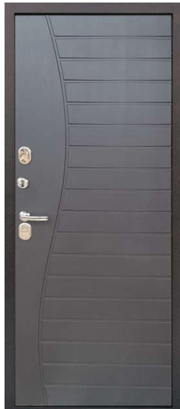
Венге темная патина