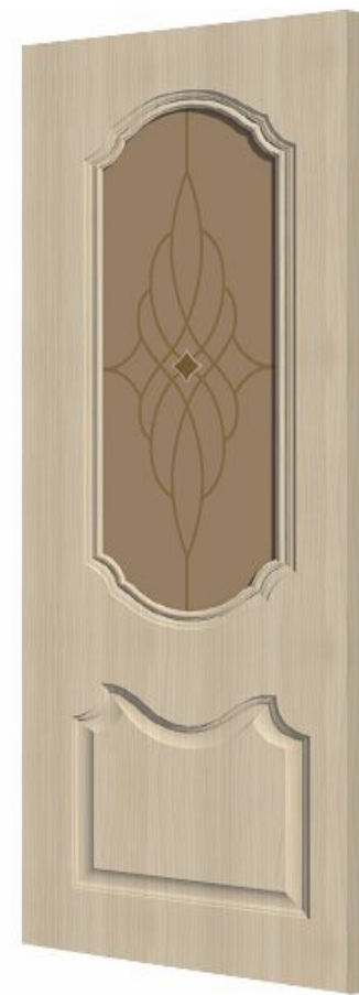
Художественное стекло с фьюзингом