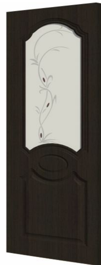
Художественное стекло с фьюзингом Ромб