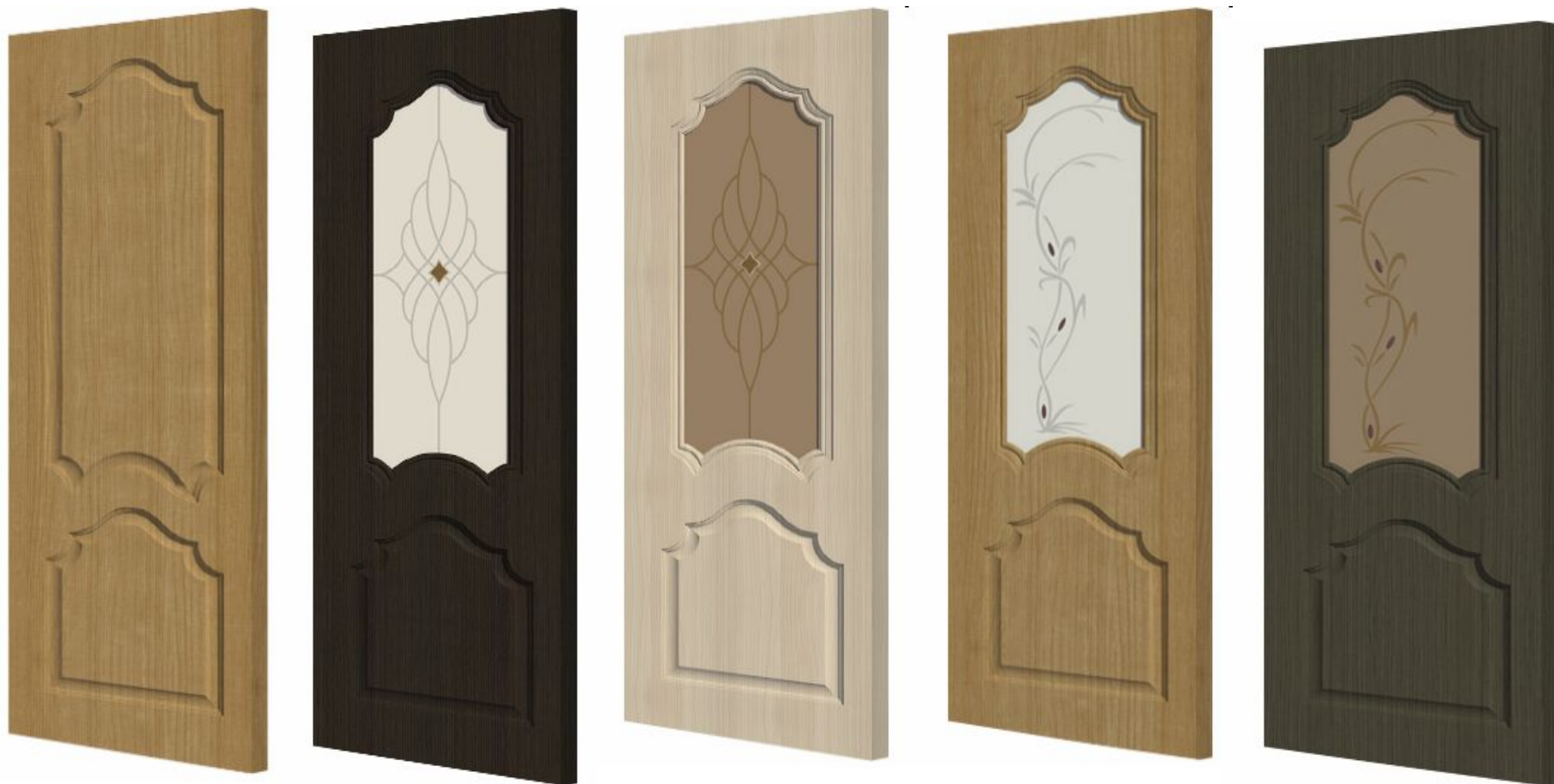
Художественное стекло с фьюзингом Ромб